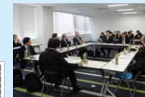
評価委員会の様子