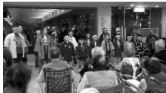
三倉小学校児童による群読

コンサートでは三倉小学校児童によるよさこいソーラン踊り、群読、さざんか少年少女合唱団による童謡の合唱が行われ、楽しいひとときを過ごしました。