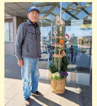
新しい年を迎えるにあたり、当院の正面玄関に立派な門松を飾りました。この門松は、心温まる有志の方によって丹精込めて作られたもので、来院される皆様をお迎えする玄関を華やかに彩りました。

今年も、公立森町病院と森町家庭医療クリニックは、地域の必要に応えるために頑張ります。引き続き地域の皆様のご理解とご協力をお願いいたします。