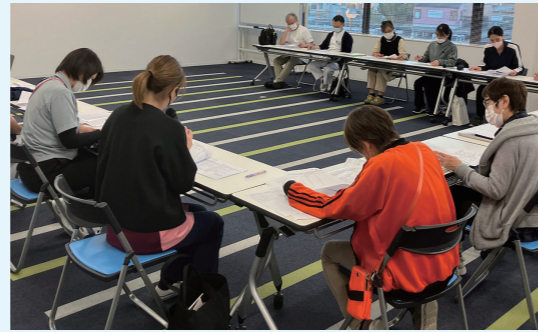
毎月開催される診療所・介護施設との協議の様子 担当患者・利用者の情報共有や連携に関する課題等を協議しています

さらに、2024年からは介護福祉施設との連携体制を強化し、静岡県から中東遠地域の在宅医療提供体制の構築を推進する積極的医療機関に当院と家庭医療クリニックが指定されました。