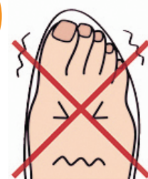
足に合った靴を履く