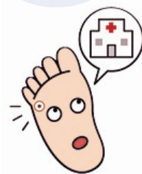
足のトラブルは 病院で処置する