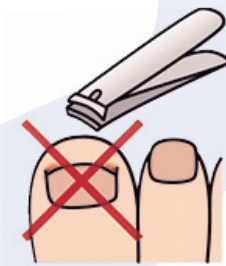
爪を切り過ぎない