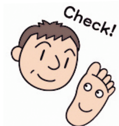
足のチェックを怠らない