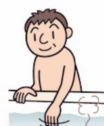
やけどに注意する