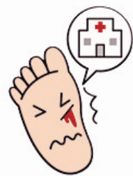
足に傷ができたら 直ちに受診する