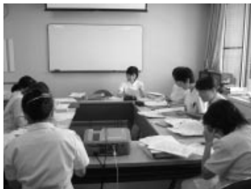
話し合いをするスタッフ

この「病院機能評価」を受審し、認定を受けることが今年度の目標にかかっています。認定に向けて職員一丸となって目標を達成したいと思います。