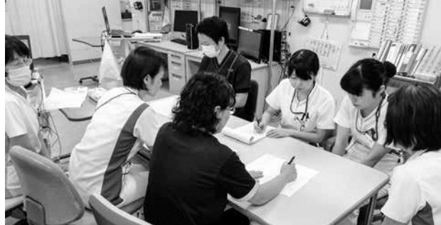
カンファレンスに参加する新人看護師(写真奥側中央2名)